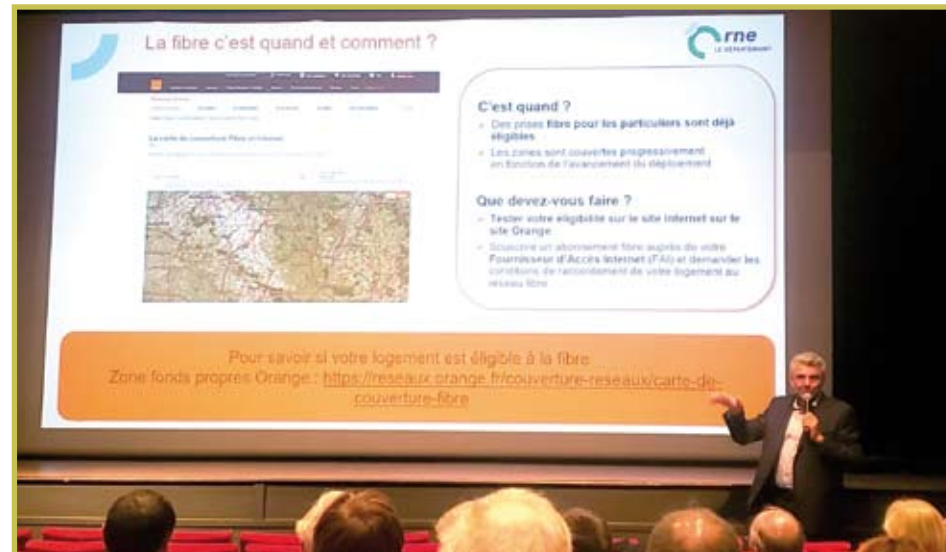
Réunion publique du 22 septembre à Rémalard

Une réunion publique a eu lieu le 22 septembre afin d'informer chacun sur les travaux réalisés pour installer la fibre sur notre territoire.