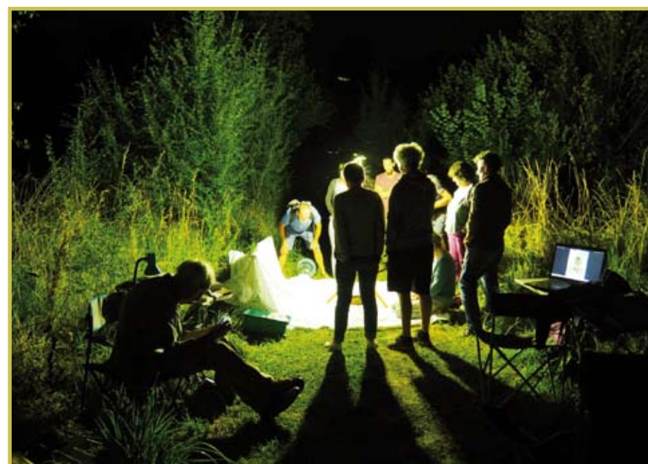
Animation papillon de nuit organisé par le Café Associatif de Préaux le 29 juillet 2022

Voici en images la preuve du dynamisme des diverses associations qui animent le territoire de notre commune. Qu'elles en soient ici remerciées !