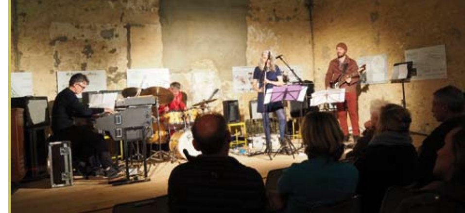
Concert de Glowing Life au Moulin Blanchard le 17 septembre 2022