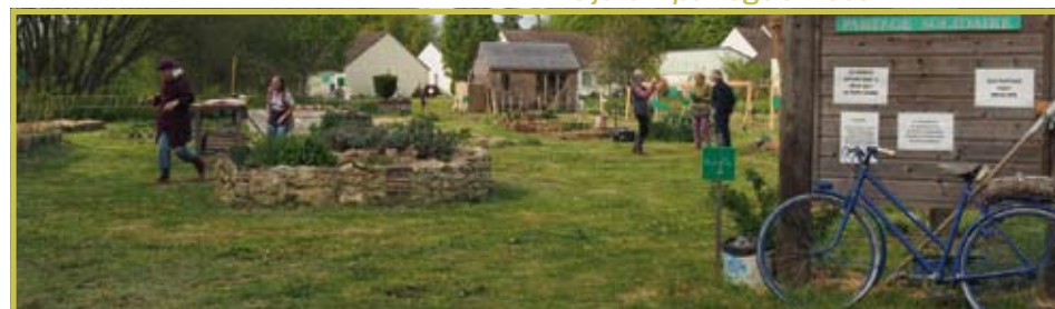
Le jardin partagé à Nocé

Club de la Joie de Vivre Nocé - Salle des fêtes