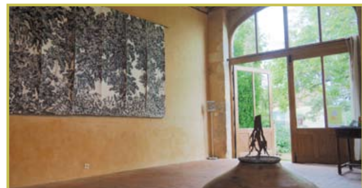
Le parcours du Champ des Impossibles à l'Ormarin à Nocé