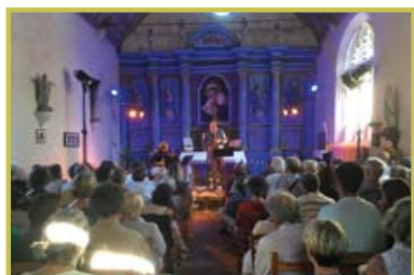
Concert l'Oreille du Perche à Corubert le 29 juillet 2022