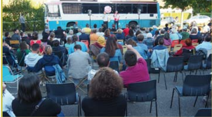
Soirée humoristique pour l'étape du «Paris-Brest-Tours» organisé par le CdF de Dancé le 5 août 2022