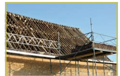
Les travaux de toiture au Moulin Blanchard

À Perche-en-Nocé, le dossier des effacements de réseaux se poursuit pour un montant de 13 879,33 € TTC, et l'ensemble de la signalétique au sol a été rénové. Il est à noter que le « STOP » devant la mairie de Nocé a été avancé de quelques mètres pour un meilleur respect de celui-ci. Enfin, l'étude de travaux de sécurisation du bourg de Nocé se poursuit