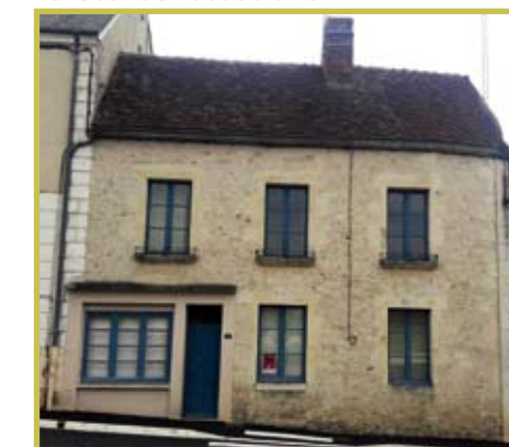
Le local de l'association