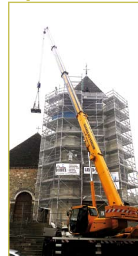
Le gros chantier de rénovation de l'église de Nocé

Enfin, différents chantiers de bénévoles ont été organisés, tels que la restauration du lavoir, ou actuellement celle du puits couvert situé à l'arrière du restaurant Le Relais du Parc.