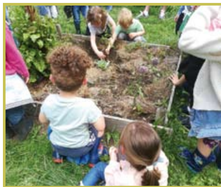
Les classes de l'école de Nocé en visite au jardin partagé

Cet ensemble vocal a mis ses voix au service du patrimoine pour le plus grand plaisir de tous, dans une ambiance chaleureuse. Un pot de l'amitié servi par les bénévoles attendait tous les spectateurs à la sortie du concert sous les arbres pour clôturer agréablement cette belle après-midi.