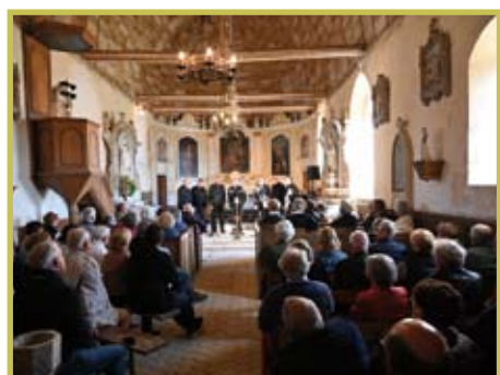
Concert de Cappellum organisé par le CdF de Saint-Aubin le 18 mai 2022