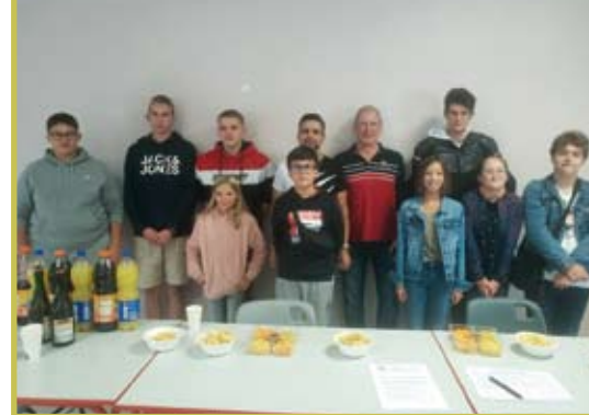
Assemblée générale de Cap Djeun's le 10 septembre 2022