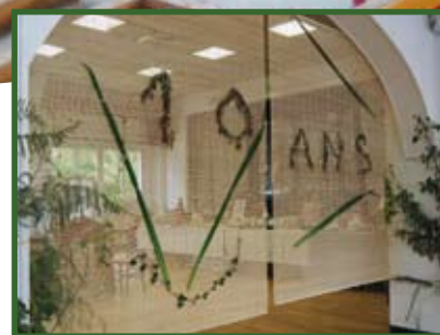
10 ANS DE NOCÉ PATRIMOINE