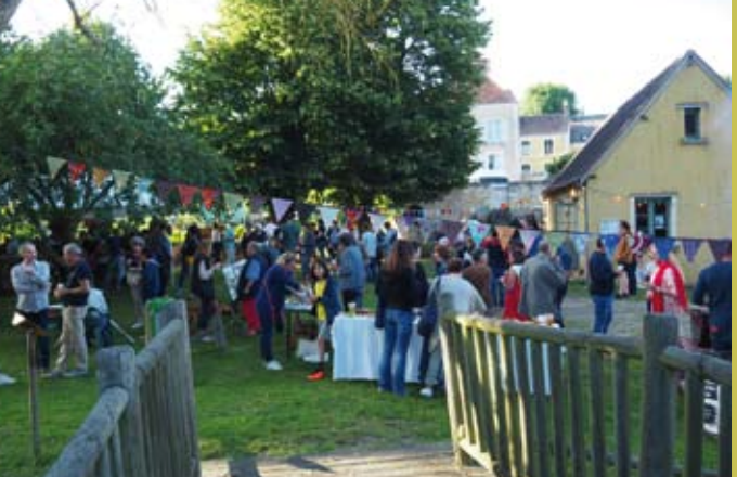
Ouverture du Pré à liens à Préaux le 10 juin 2022