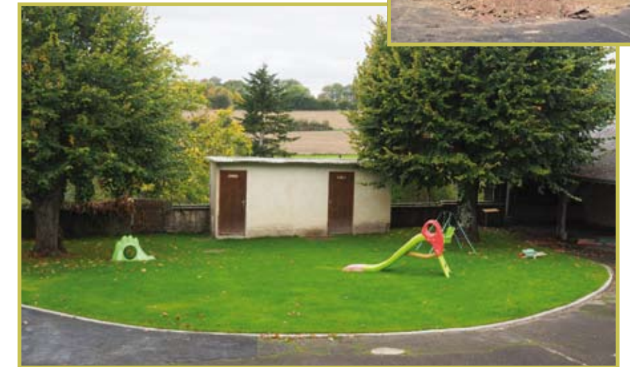
La végétalisation de la cour de la M.A.M., avant et après

Beaucoup de retours positifs de la part des familles qui ont été très sensibles à cet aménagement.