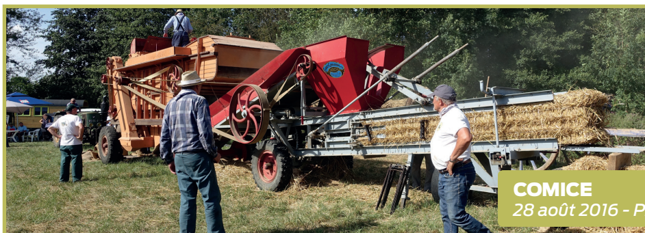
COMICE 28 août 2016 - Préaux