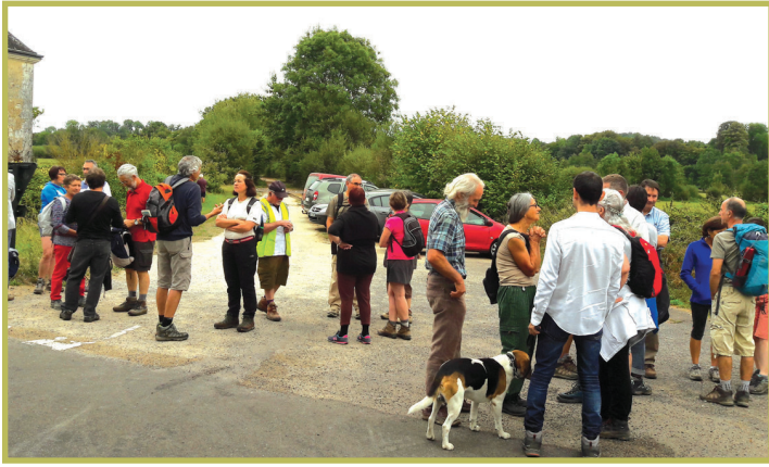
Le 4 septembre, 35 marcheurs se sont retrouvés pour ouvrir la « Grande Traversée » de la CDC de Perche Sud, de Boissy-Maugis à Ste-Gauburge via Courboyer.