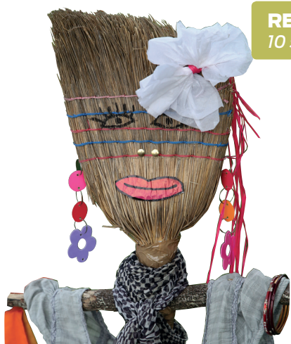
REPAS ANNUEL 10 sep 2016 - St-Aubin