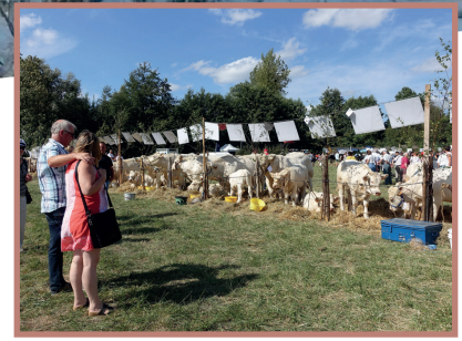
LE COMICE AGRICOLE