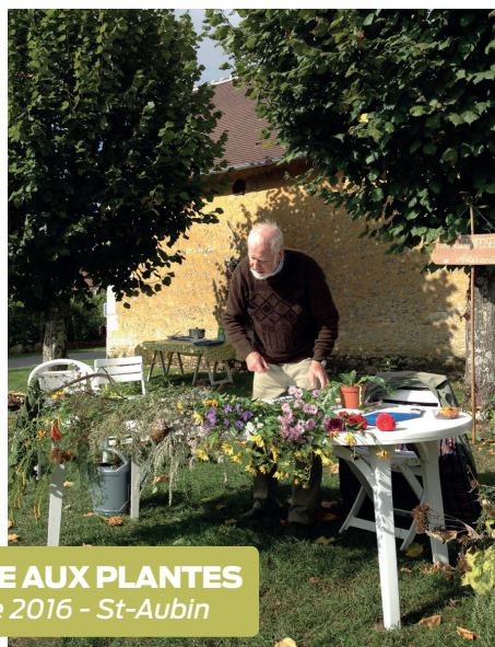
BOURSE AUX PLANTES 2 octobre 2016 - St-Aubin

Tout au long de l'année, eco-pertica propose des animations sur l'éco-vivre (soirée d'information gratuite, ateliers d'initiation, visites).