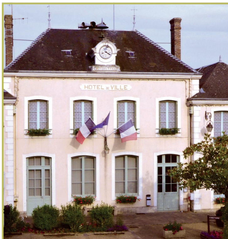
La mairie de Perche-en-Nocé

Pascal Pecchioli - Maire de Perche-en-Nocé