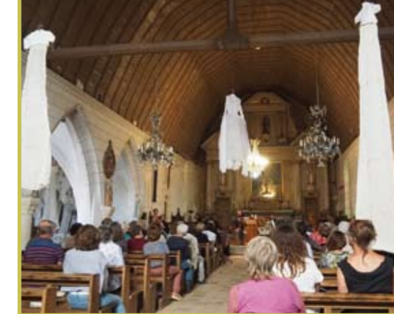
Concert Tangoléon à Préaux le 20 juin 2021