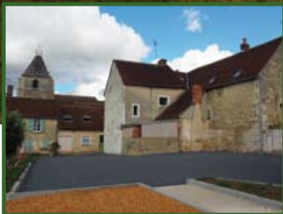
LES TRAVAUX 2021