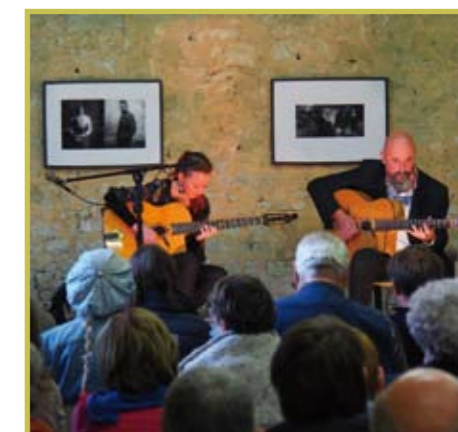
Concert au Moulin Blanchard à Nocé le 7 août 2021