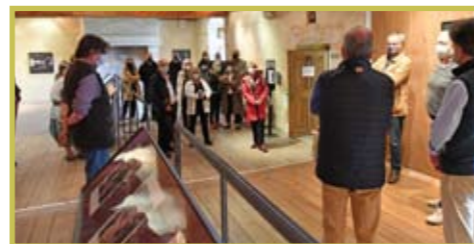
Vernissage exposition « Mémoires et Ruralités » au Parc Naturel Régional du Perche à Nocé le 10 juillet 2021

Voici en images la preuve du dynamisme des diverses associations qui animent le territoire de notre commune. Qu'elles en soient ici remerciées !