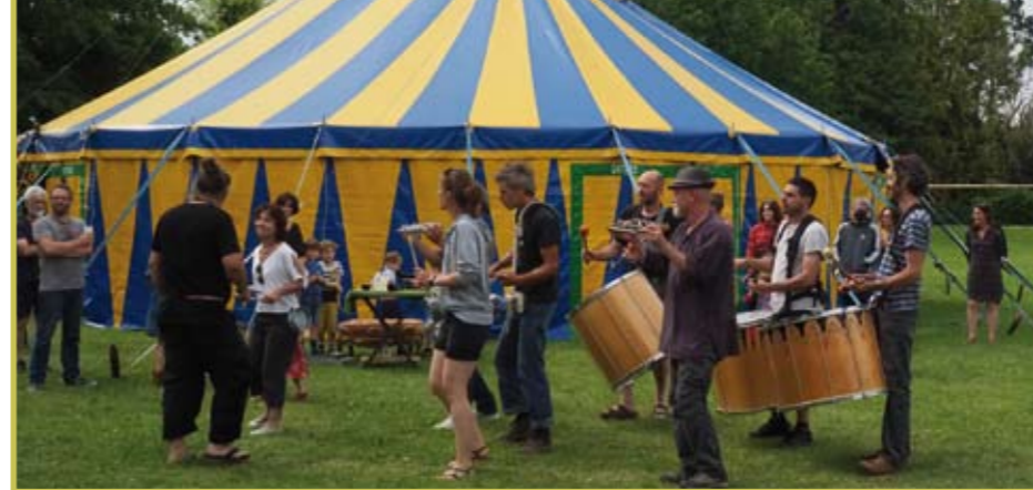
Karafon à Préaux du 18 au 20 juin 2021