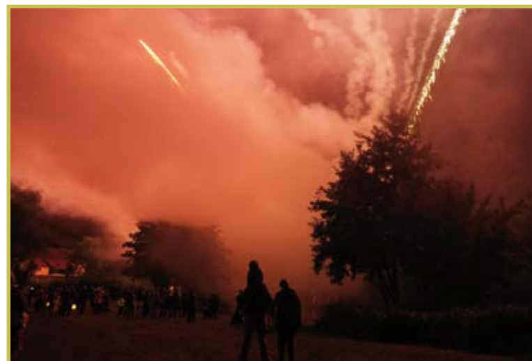
Fête à Préaux le 4 septembre 2021