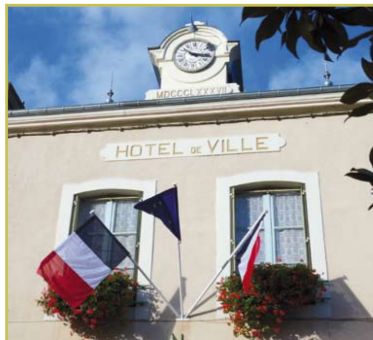
La mairie de Perche-en-Nocé

Pascal PECCHIOLI - Maire de Perche en Nocé