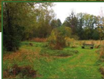
PRÉAUX : PARC NATURE