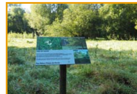
Le parc nature