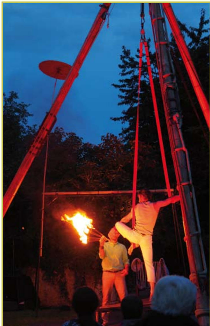
Spectacle au théâtre de la Basse Passière le 19 août 2021