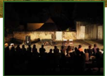
VIE ASSOCIATIVE : REPRISE