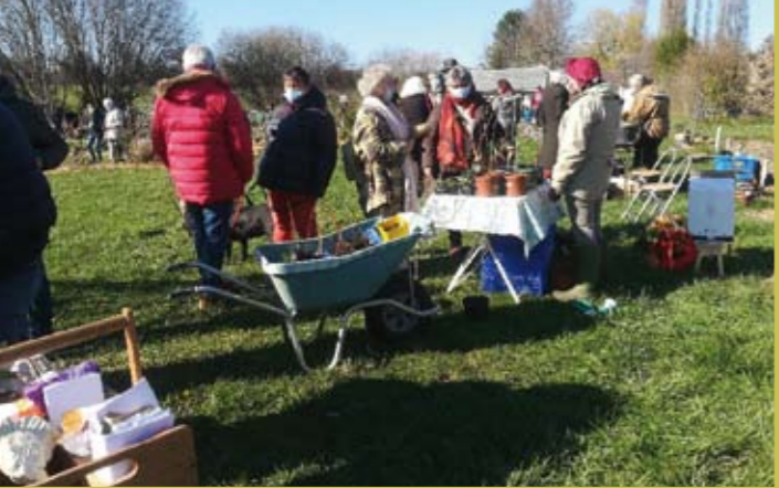
Troc graines au jardin partagé à Nocé le 6 mars 2021