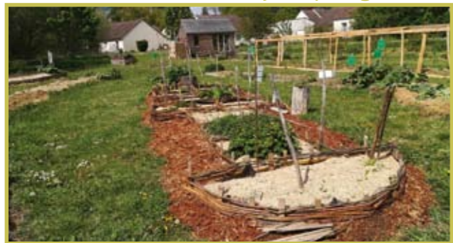
La marelle au jardin partagé de Nocé