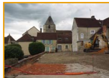
Parking du centre bourg