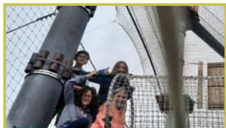
Sorties de Cap Djeun's en juillet 2021