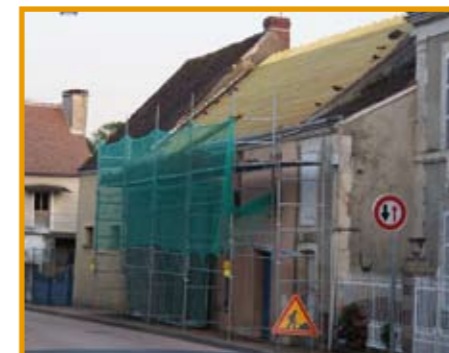
La boulangerie de Préaux