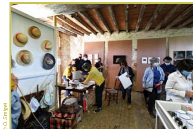
Exposition du parcours du Champ des Impossibles au Moulin Blanchard

Voici en images la preuve du dynamisme des diverses associations qui animent le territoire de notre commune. Qu'elles en soient ici remerciées !