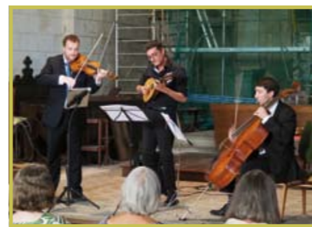
Concerts Préaux Patrimoine Ci-dessus : musique italienne ancienne et populaire (19/07) Ci-dessous : Echoes of Time (15/09)

JOURNÉE - FÊTE DU JARRET Sortie à Dénézé-sous-Doué Génération mouvement Coeur du Perche Nocé - Salle des fêtes