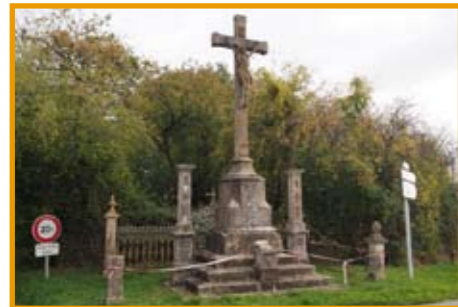
Le calvaire avant les travaux