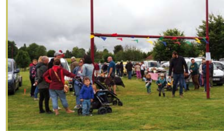
Vide grenier du Comité des fêtes de Dancé le 8 septembre