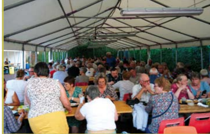
Fête communale du Comité des Fêtes de Nocé le 20 juillet