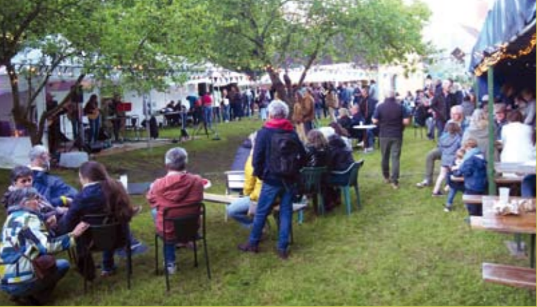
Les 2 ans du Café Associatif de Préaux le 15 juin