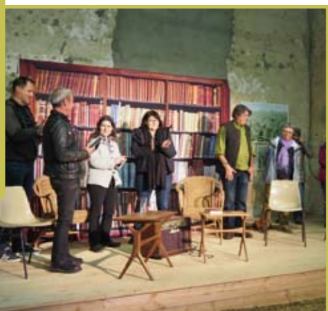
Festival Polar de l'association Moulin Blanchard le 14 septembre