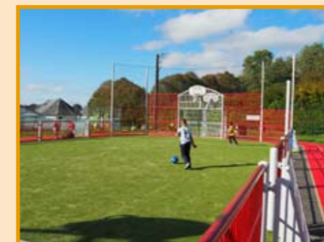
Sports collectifs : foot ou basket