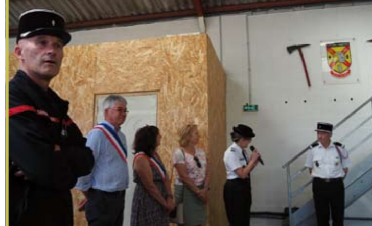
Les 120 ans du centre de secours des pompiers le 21 juillet