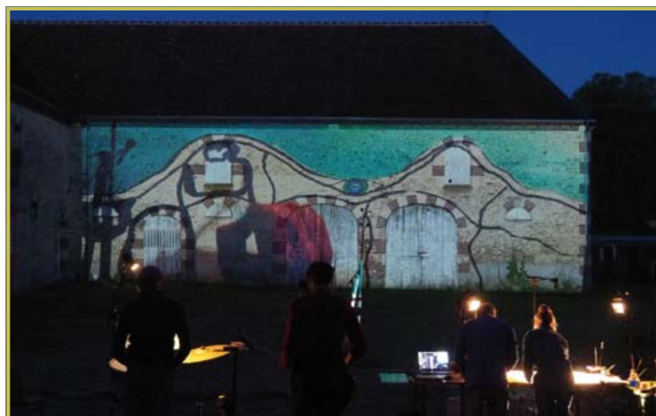
Soirée Mycelium Hundertwassers de l'association Moulin Blanchard le 6 juillet