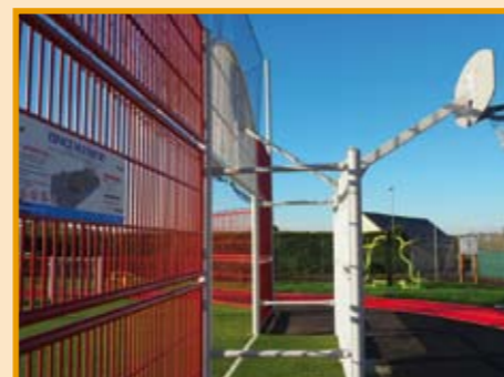
L'entrée du multisport

Une table de pique-nique est disponible ainsi qu'un abri en cas de pluie équipé d'un défibrillateur. Le choix des activités sportives offert par ce site donne l'occasion de se détendre, se divertir, se rencontrer et d'échanger.