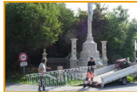
La mise en place de la grille