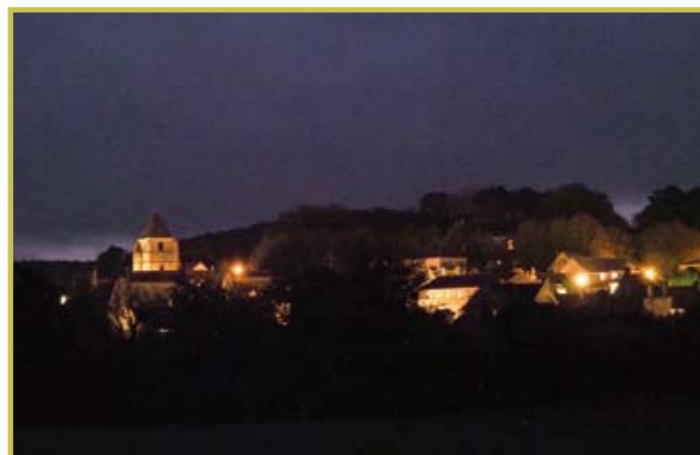
Impact sur l'éclairage public à Nocé