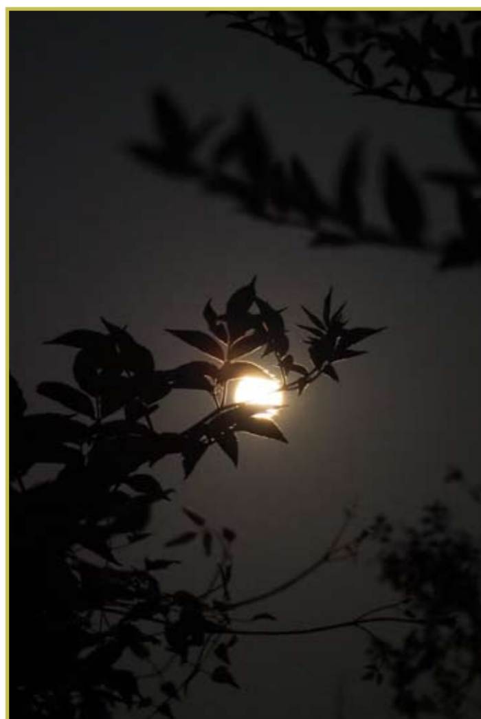
Ambiance nocturne à Perche-en-Nocé