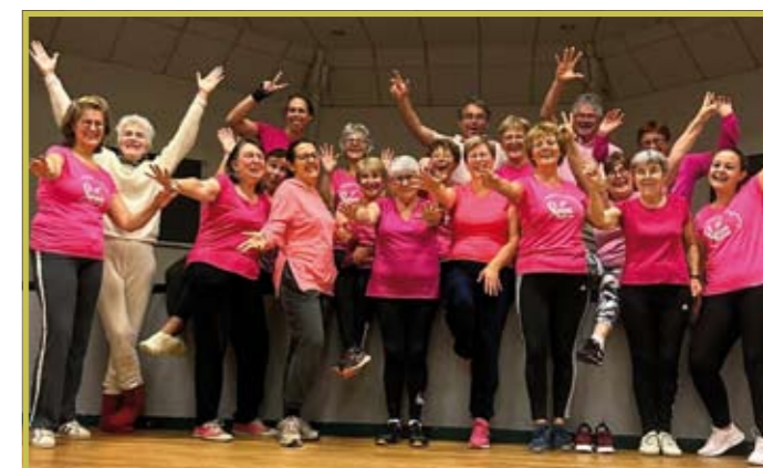
Octobre Rose le 13 octobre de la Gym Volontaire Nocéenne et de Gym et Loisirs de Préaux