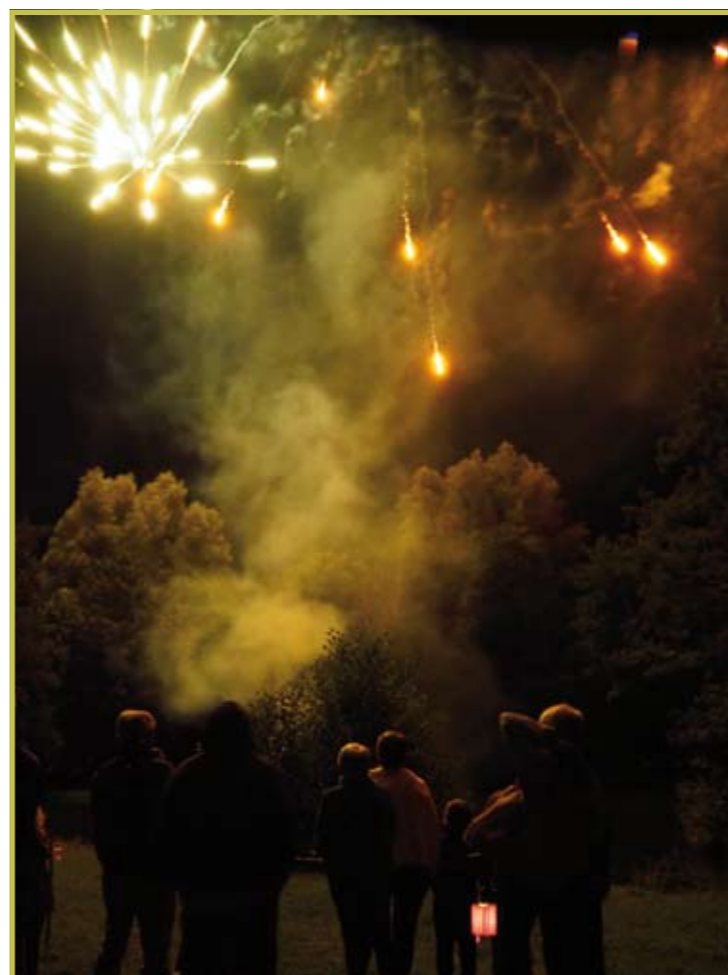
Feu d'artifice du cochon grillé à Préaux le 24 août